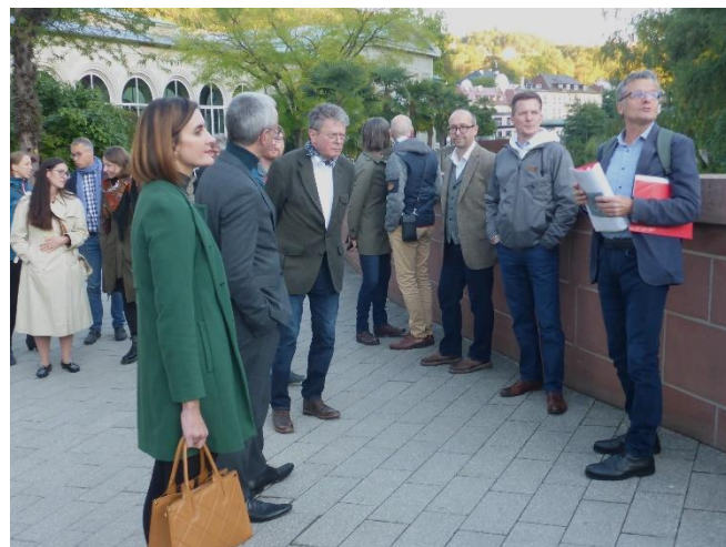
Teilnehmer der Mitgliederversammlung des BDS