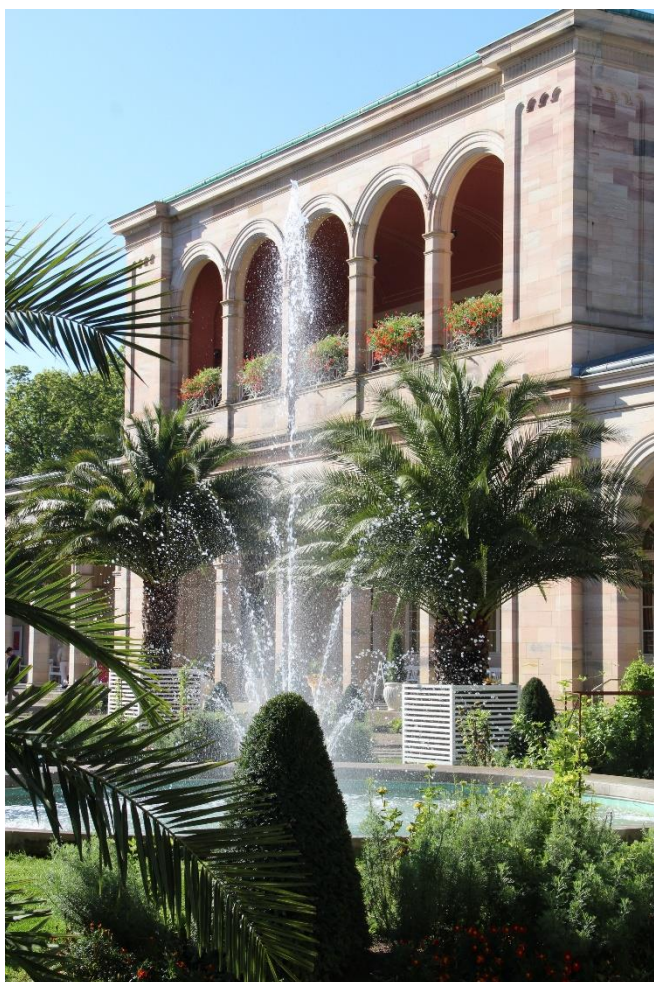
Bad Kissingen