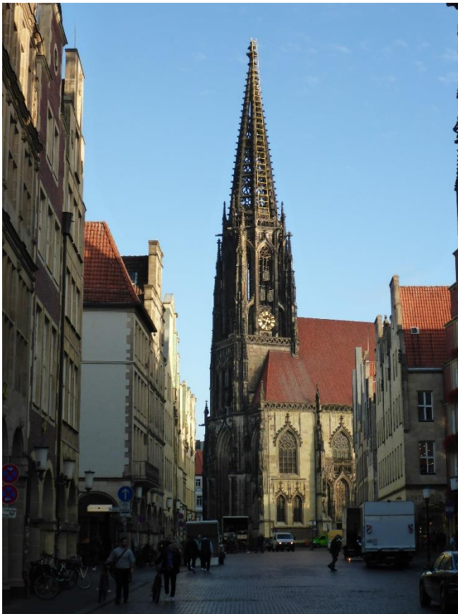
Lambertikirche, Münster

Unternehmen der Privatwirtschaft leisten. Auch inhaltlich müsse sich einiges ändern. So würden Nachhaltigkeit und Klimaschutz auch in der universitären Ausbildung deutlich zu kurz kommen.